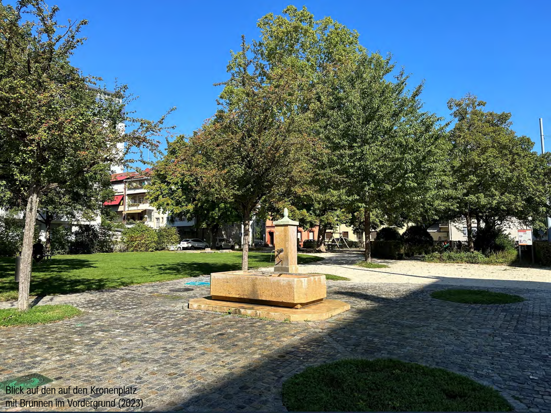
Blick auf den auf den Kronenplatz mit Brunnen im Vordergrund (2023)