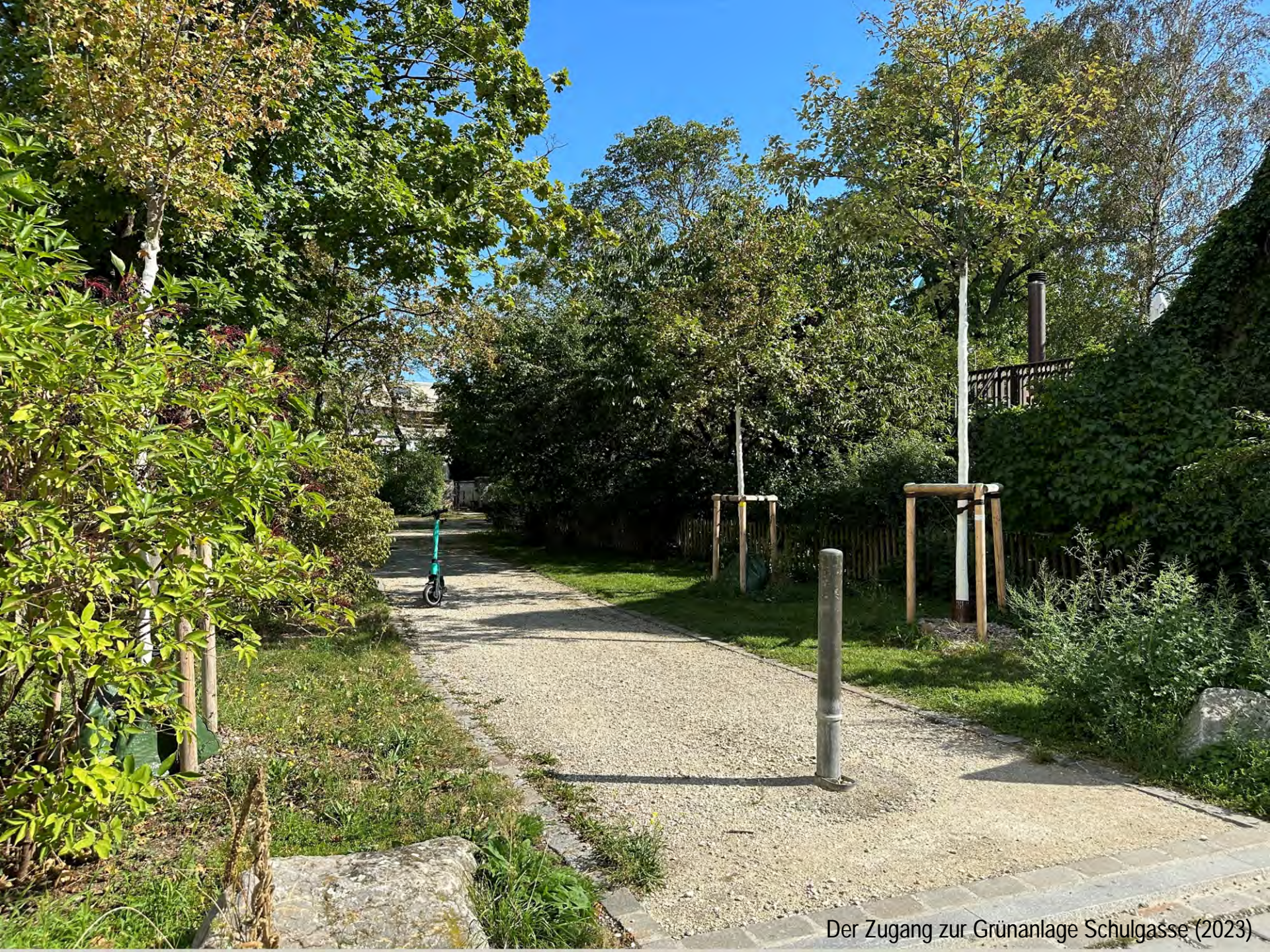
Der Zugang zur Grünanlage Schulgasse (2023)