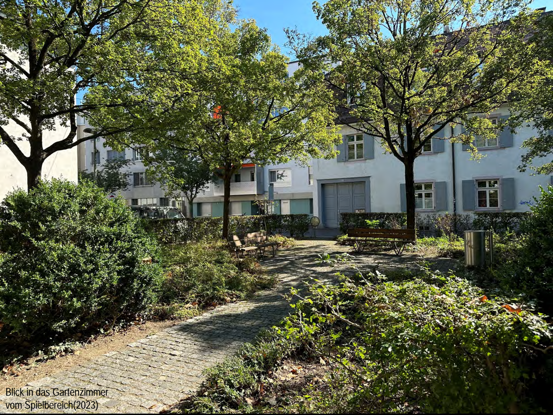
Blick in das Gartenzimmer vom Spielbereich(2023)