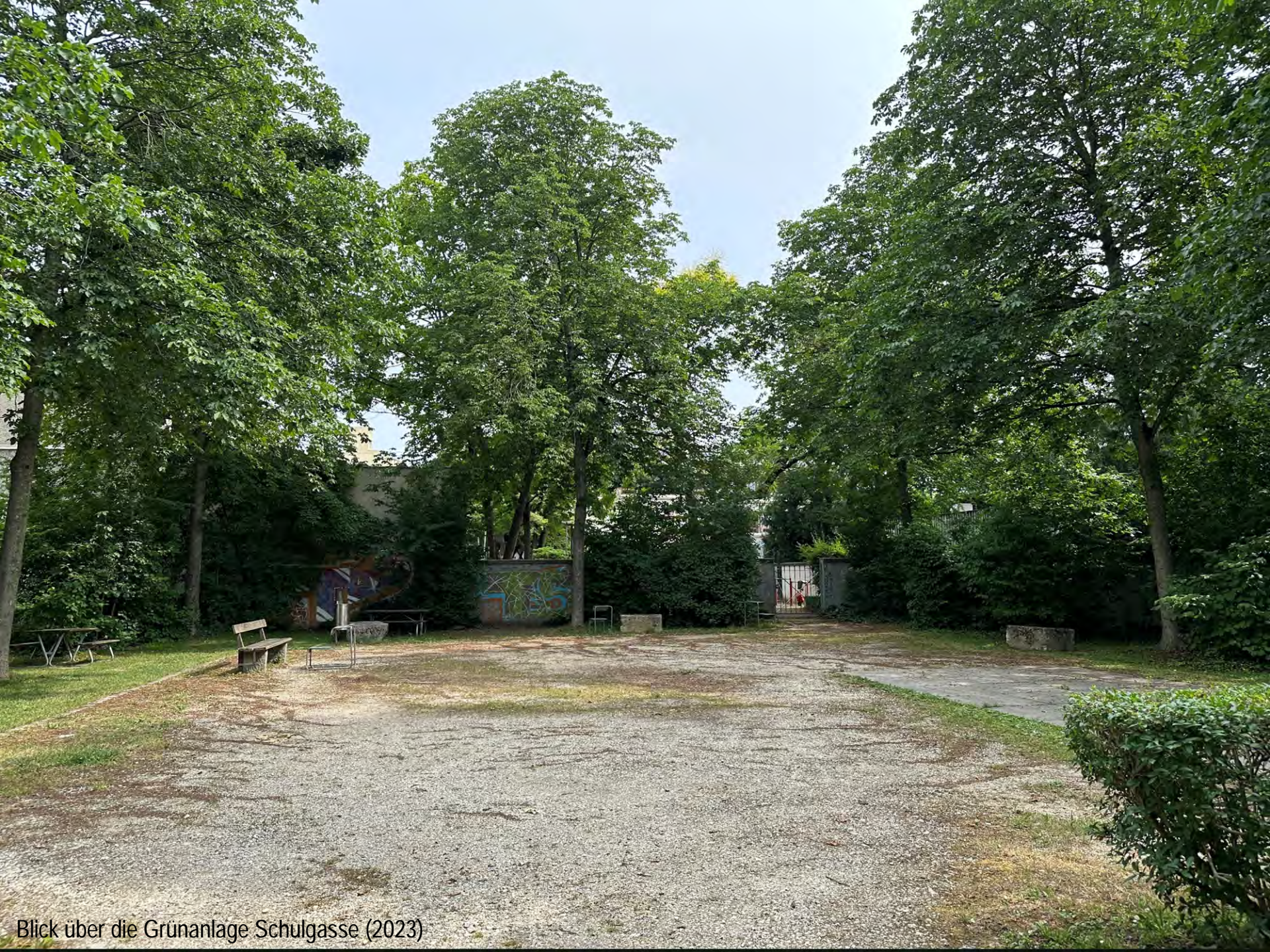
Blick über die Grünanlage Schulgasse (2023)