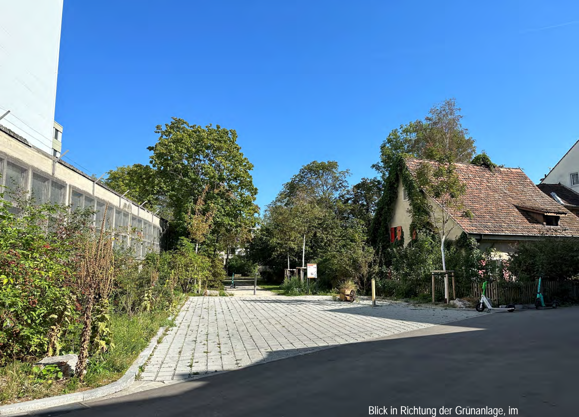
Blick in Richtung der Grünanlage, im Vordergrund der Wendeplatz Schulgasse (2023)