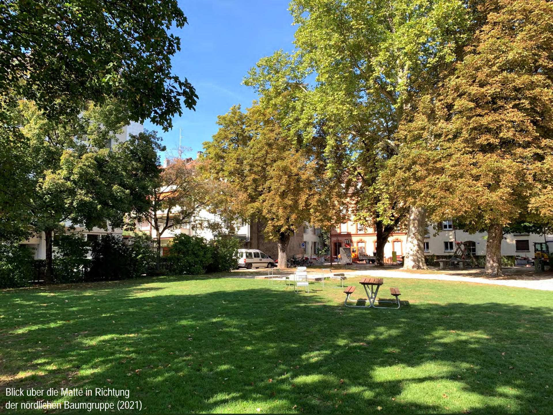
Blick über die Matte in Richtung der nördlichen Baumgruppe (2021)