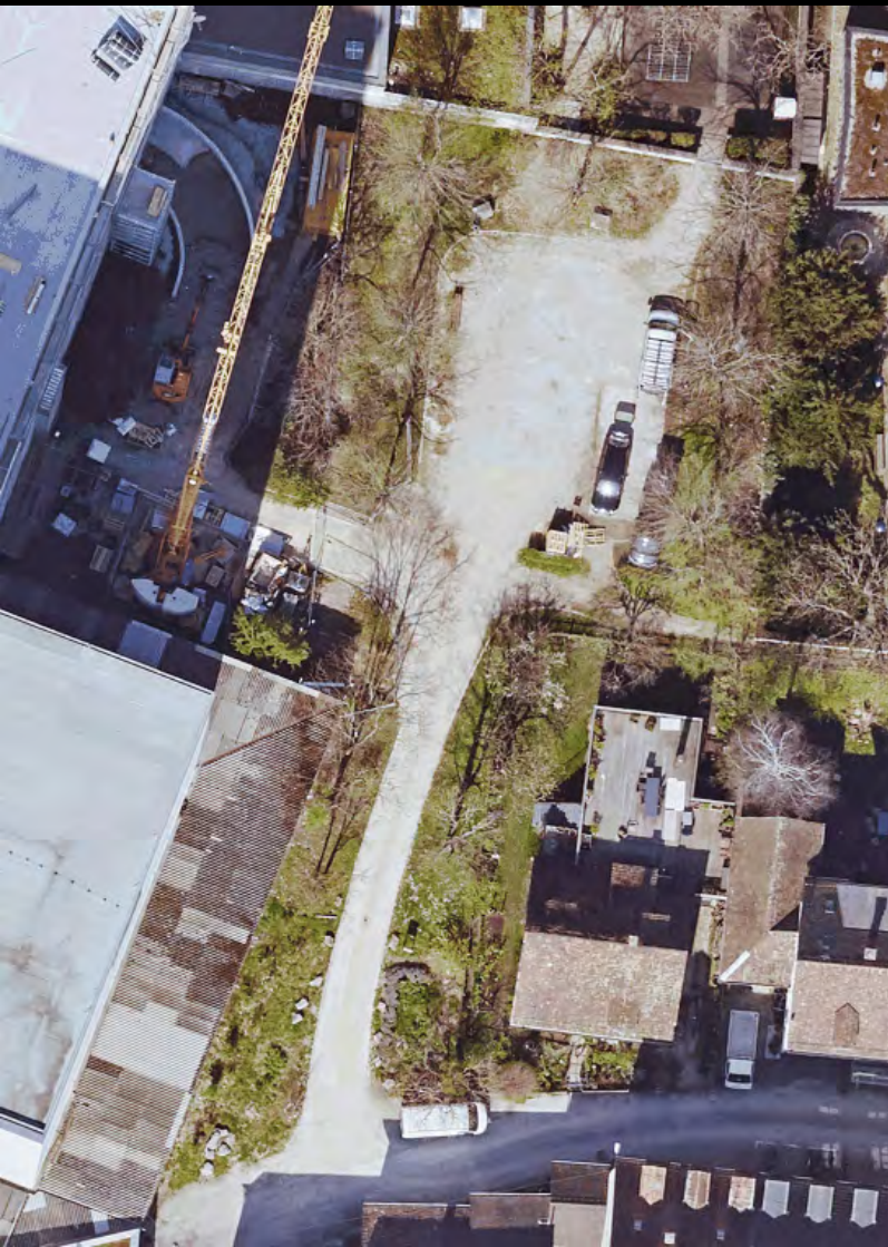
Orthofoto März 2020