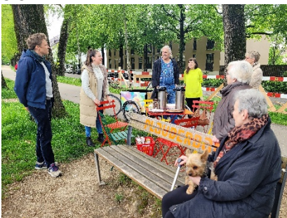
Einweihung am Stückisteg

Eine Parkbank ist ein Ort, an dem wir verweilen und unkompliziert einen Schwatz halten könnten. Ein oranger Schriftzug weist die Plauderbänke als solche aus: wer sich hier hinsetzt, kann angesprochen werden. Die Einladung von der Quartierarbeit Klybeck/Kleinhüningen zur geselligen Einweihung der Plauderbank beim Wiesendamm, Höhe Stückisteg wurde zahlreich angenommen. Es wurde munter kreuz und quer geplaudert und sich ausgetauscht. «Das Plauderbänkli dürfe ruhig komplett farbig gestalten werden, damit es besser sichtbar werde», meinte eine Besucherin. Auf dem Schorenplatz im Hirzbrunnen und am Wiesendamm, sind zwei der drei geplanten Plauderbänke realisiert.